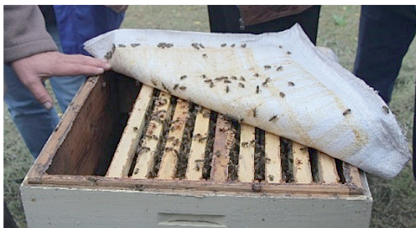
Нижний корпус улья с идущей в зимовку семьей и утепленная 5-сантиметровым пенополистиролом крыша улья.