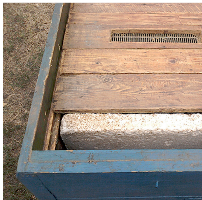
Роль диафрагмы выполняет лист полистирола