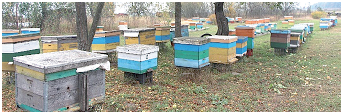
Одна из пасек семьи Станевичей в д. Лучки