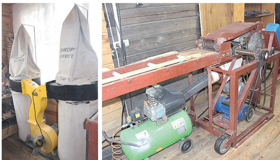
Оборудование для производства ульев, рамок, кормушек и т.д.