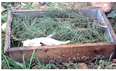
Кормушка для закармливания пчел на зиму, наполнитель – ветка сосны

Сироп разливается в деревянные кормушки в виде корытца, которые плотно набиваются ветками сосны.