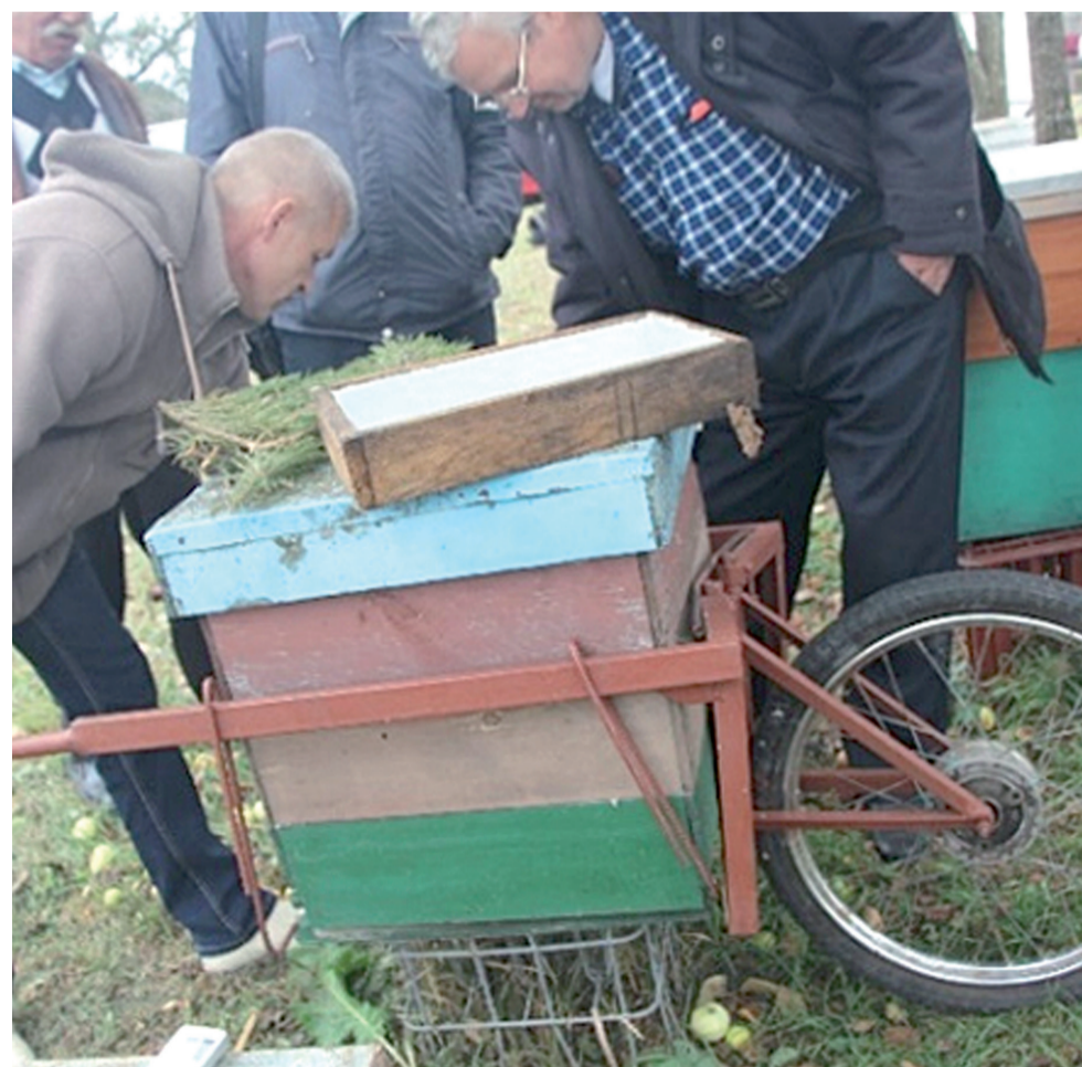
Устройство для поднятия и транспортировки улья.