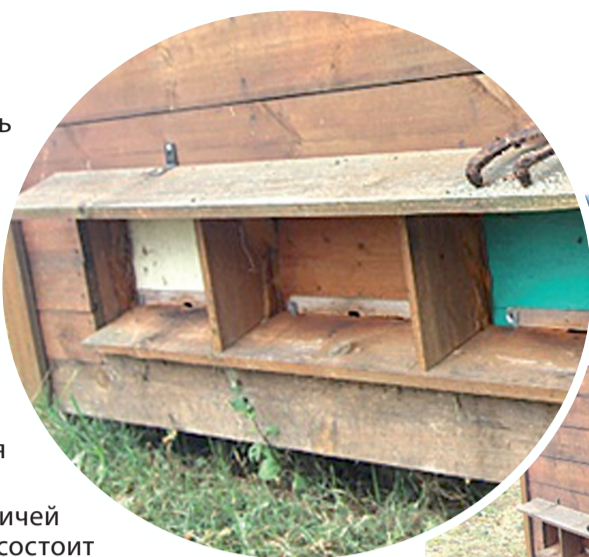
Апидомик на 8 пчелосемей.

Апидомик – для пасечника. Всем хорошо известно сооружение «апидомик», предназначенное для восстановления сил человека, лежащего над ульями с пчелами. Этот процесс основан на влиянии энергии пчел на состояние людей. Пчеловоды стали замечать, если пускать отдохнуть в апидомик друзей и знакомых, то после их посещения пчелы хоть и зимуют, но практически не развиваются весной и не несут меда. Во время отдыха в домике