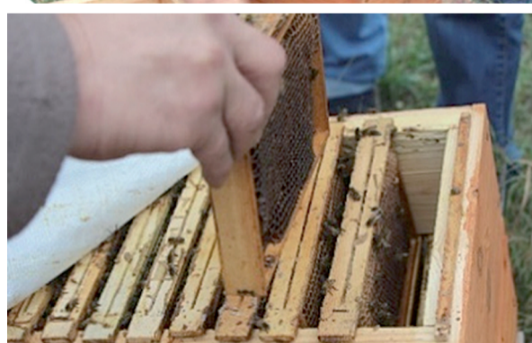
Корпусные нуклеусы для вывода и временного содержания маток