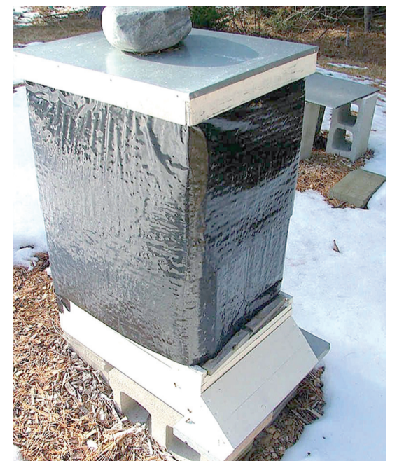
Улей защищен от ветра пленкой