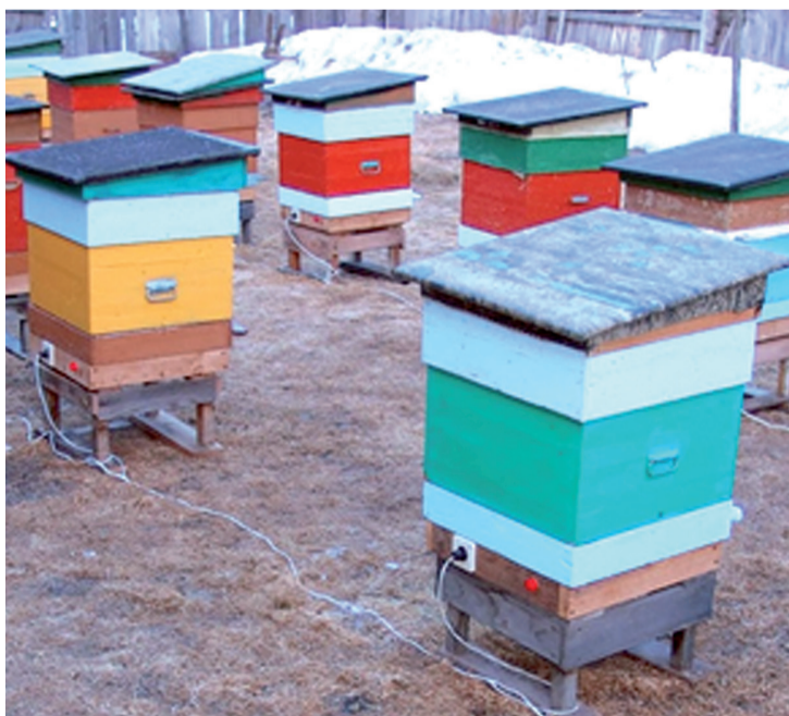
Зимовка пчел в ульях с электроподогревом

От редакции: Автор поднимает достаточно важную тему, поскольку результат зимовки пчел и есть результат продуктивности семей в будущем году. Просим указанных в статье сторонников холодной зимовки, равно как и всех пчеловодов, аргументировать свои доводы по преимуществам своего способа содержания пчел зимой и дослать на адрес редакции. В споре рождается истина.