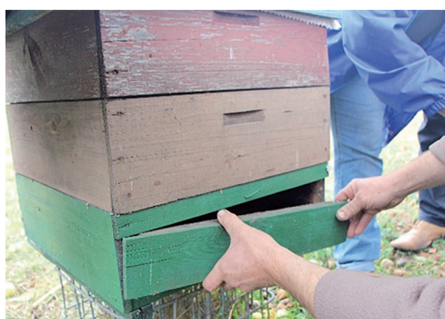
Улей с сетчатым дном для кормушки.